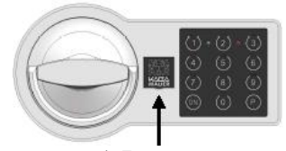
рис. 1. Внешний вид

При вводе комбинации каждое нажатие на кнопку клавиатуры подтверждается звуковым сигналом.