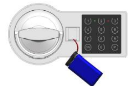
рис. 3. Подключение внешней батареи